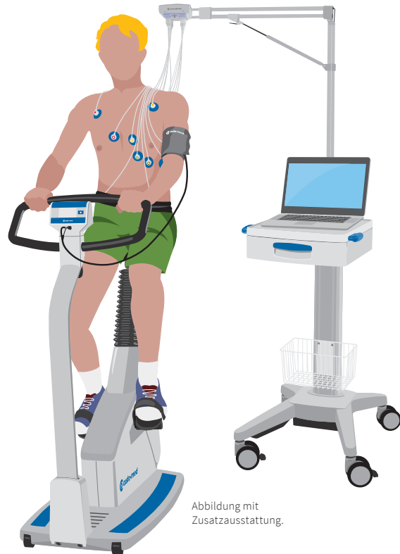
Abbildung mit Zusatzausstattung.