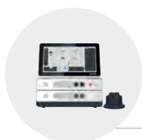
Combi ET control unit + US module