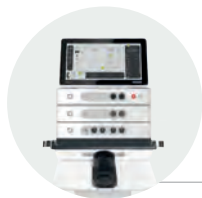
Combi ViP ET control unit + US module + Vaco module + Mobil Fit