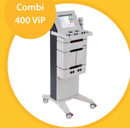
Combi 400 ViP