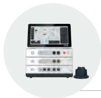
Combi V ET control unit + US module + Vaco module